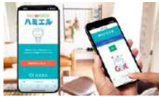
株式会社ハミエル