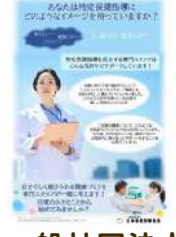
一般社団法人 日本保健指導協会