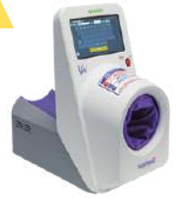
株式会社 ウェルクル