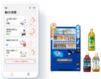
サントリービバレッジ ソリューション株式会社