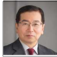
愛媛県西条市 市長 高橋 敏明氏