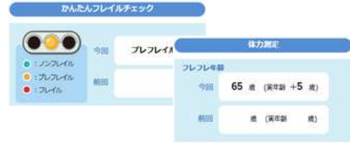
株式会社マクニカ