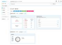
株式会社エムステージ