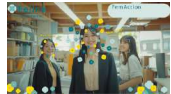
株式会社オカモトヤ